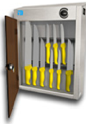
Model 725 SM met messen-magneetsrips

Uitwendig : DXBXH 130 x 500 x 590 mm Netto inwendig : 120x 500 x500 Elektrisch : 220/230 V. Verbruik UV C lamp : 18w