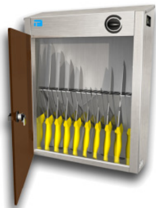
Model 725 met messen-frame