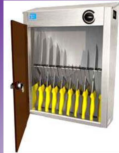
Desinfectie met UV-C