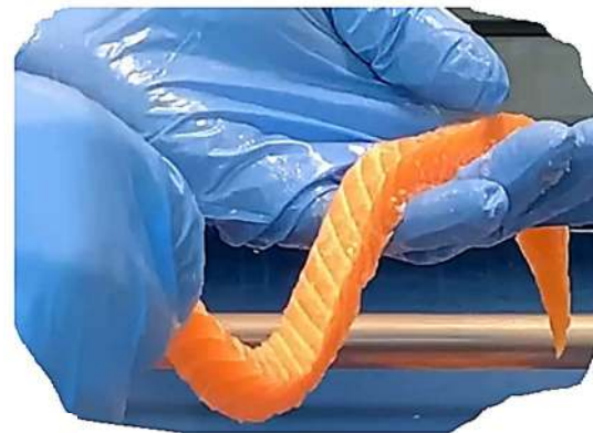
Strips in iedere gewenste breedte en lengte