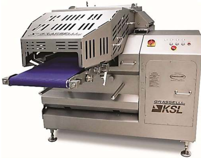
KSL 400 horizontaal Slicer (vanaf D-2,5 mm)