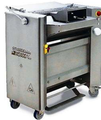
Open Top Skinning