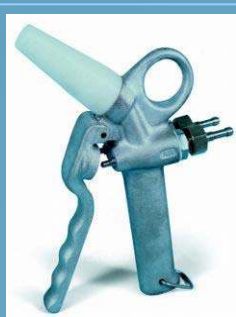
Sproeier Zolenreiniging perslucht + water