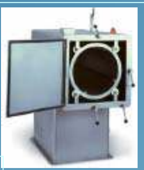
Stokken-wasmachine (max. L 1.200mm) ook meatbrackets