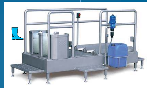
Modulair doorloopstation laarzen