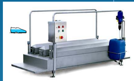
Doorloopstation laag schoeisel